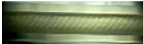
環状流の観察結果