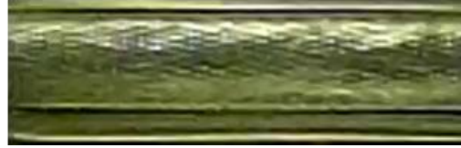
環状流の観察結果