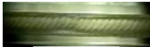
波状流の観察結果