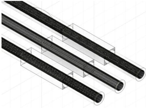
設計した 3D モデル