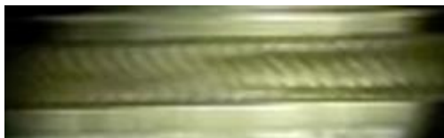
スラグ流の観察結果