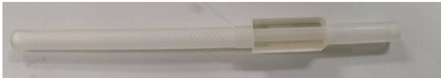
最大内径 3.6 mm の試験区間