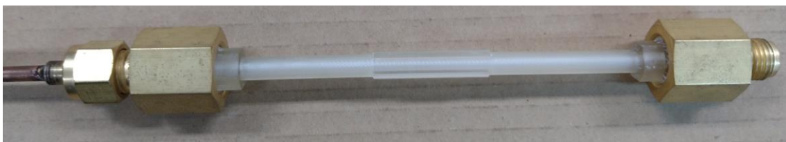
試作した冷媒用観察区間