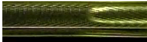
スラグ流の観察結果